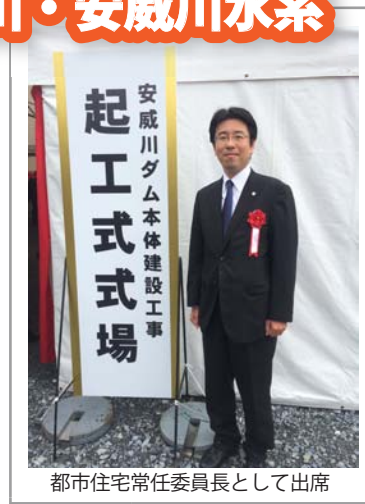
都市住宅常任委員長として出席

西淀川区の神崎川沿いの地域は、防潮堤の耐震工事を急ピッチで進めています。また、平成26年11月、安威川ダムの本体起工式に加治木府議も出席しました。平成32年度に完成すれば、茨木、高槻、吹田、摂津、大阪の流域5市の洪水被害が防げます。