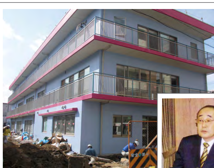
完成間近のポラリス保育園 (3月3日)