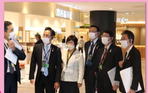
◀ 施設改修の説明を受ける公明府議団