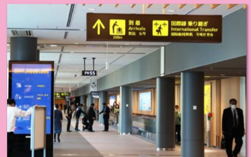
▲ 新しくなった国内線エリア通路

今後は2025年万博に向け、国際線エリアの改修が進められます。利用しやすい空港づくりを進めていきます。