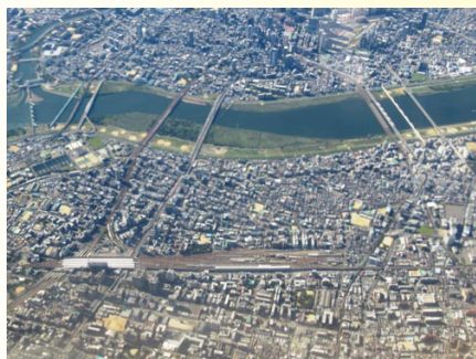
上空から見た新大阪駅周辺

今年度中に骨格をまとめ、民間の創意工夫を生かした都市開発プロジェクトの機運醸成に努める、とのこと