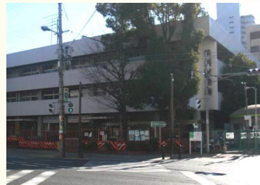
旧淀川区役所の建物