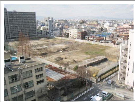
市営住宅建設予定地

西宮原三丁目の市営住宅建設予定地に二〇一〇年四月、保育所が新設されます。百―二百人程度の受け入れを予定しており、淀川区内の待機児童問題の解消に大きく前進します。